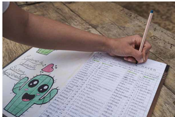
Caderno de campo para anotações referentes ao SAF

Um dos desafios de execução do projeto foi o período da pandemia, gerada pelo novo Coronavírus (COVID-19), implicando na aquisição dos materiais e insumos, bem como no processo de formação e acompanhamento mais sistemático. Como estratégia da gestão do projeto, mensalmente acontecia reuniões para capacitação, orientação e monitoramento das ações