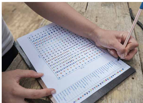
Croqui da área identificando as principais espécies implantadas

Atualmente o SAF conta com diversidade de plantas perenes e anuais que produzem alimentos, flores, madeira, matéria verde para a cobertura do solo, promovem a fixação de nitrogênio no solo, além de produzirem sementes crioulas.