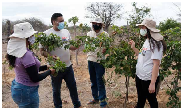
Acompanhamento de Campo pelo Monitor e Coordenação