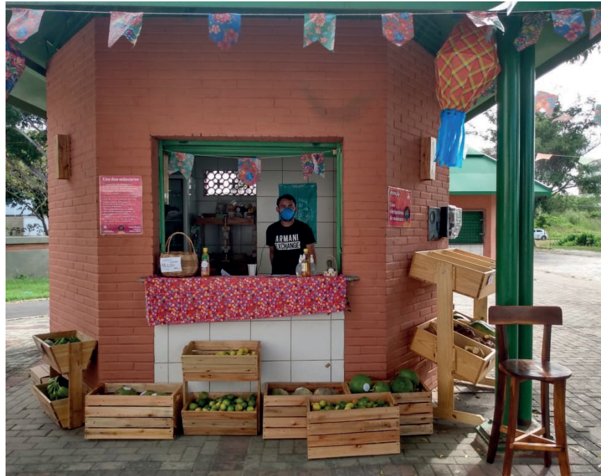
Quiosque Agroecológico em funcionamento – 25 de junho de 2021