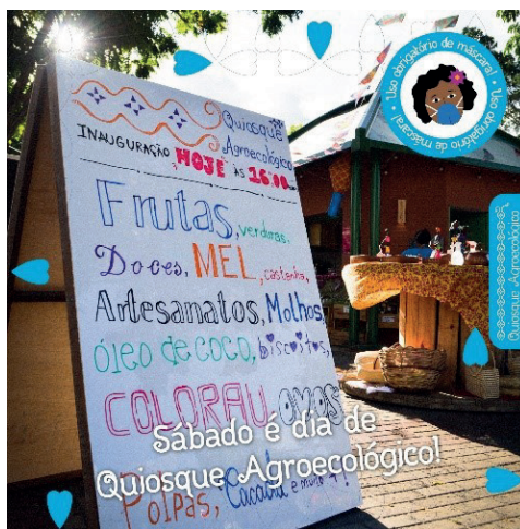
Quiosque Agroecológico em funcionamento – 25 de junho de 2021