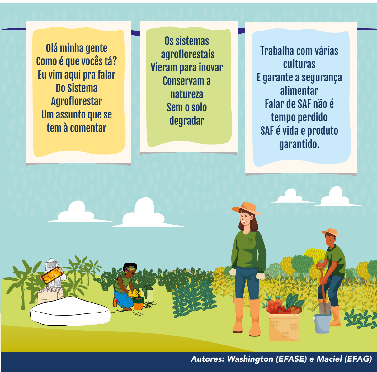
Autores: Washington (EFASE) e Maciel (EFAG)